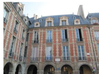
Maison de V.Hugo Place des Vosges

Prochaine date: Dimanche 8 Novembre : RV à 14h pour la visite guidée de la maison de Victor Hugo, 6 Place des Vosges 75004 ; Métro Bastille ou St Paul, Ligne 1 ;