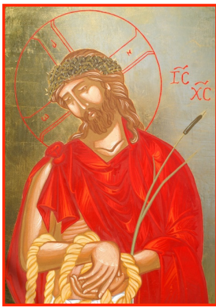
Ecce Homo - Ch. B

Nous voici en carême, temps de grâce proposé par l'Église pour revenir vers Dieu : notre créateur et Père, le Fils : notre sauveur et frère, et l'Esprit qui nous fait vivre en fils. Bientôt nous serons invités pendant la Semaine Sainte à marcher à la suite de Jésus-Christ venu pour nous ouvrir le chemin du Salut.