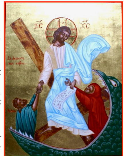
La descente aux enfers

" Christ 'Dieu avec nous' descend au fond de la terre pour chercher chacune des brebis perdues. C'est l'œuvre de ses mains ; Il remontera chacun dans les hauteurs pour offrir et remettre à Dieu cet homme retrouvé. Chaque membre tiendra dans le Corps une place qui lui est propre et lui convient ; nombreuses sont les demeures chez le Père puisque nombreux sont aussi les membres de son Corps. Notre Dieu est magnanime en prévoyant d'accorder à l'homme défaillant cette victoire par le Verbe, car tandis que la puissance se déployait dans la faiblesse, le Verbe montrait la bonté de Dieu et la puissance sa plus sublime ". Saint Irénée