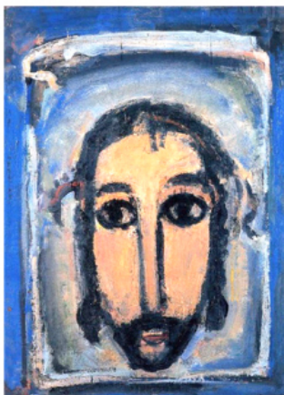
Rouault - Le Saint Suaire -

Le Carême, c'est aussi l'occasion de resserrer nos liens avec notre prochain, et, tout spécialement à LCE, d'accompagner nos frères et nos sœurs malades qui vivent dans la solitude, d'aller les visiter, d'être à leur écoute, de savoir reconnaître et partager les moments de désespoir où la vie bascule ; c'est oser demander à ceux qui sont partis vers le Père — notre Délégation du Ciel — de les accompagner et de les accueillir.